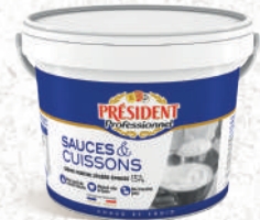
Crème pour Sauces & Cuissons Épaisse & Légère Seau 5L