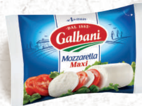
Mozzarella «Maxi» Boule 250g