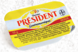
Beurre Doux et Demi-sel Microbeurrer 10g