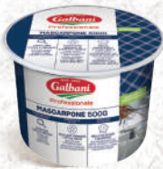
Mascarpone Pot 500g ou 2kg