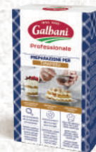
Préparations pour desserts : Tiramisu et Panna Cotta UHT Brique 1L