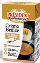
Crèmes Brûlées à la Vanille Bourbon, Vanille Bourbon avec Grains, Pistache et Caramel au Beurre Salé UHT Brique 1L