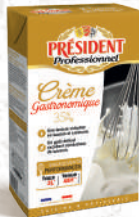
Crème Gastronomique 35% UHT Brique 1L