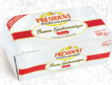
Beurre Gastronomique Doux et Demi-Sel Plaquette 500g