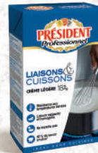
Crème Légère Liaisons & Cuissons 18% UHT Brique 1L