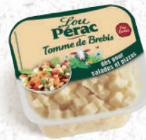
Dés de Tomme de brebis Barquette 500g