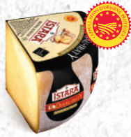
Ossau Iraty ISTARA Affiné 6 mois Environ 1,1kg