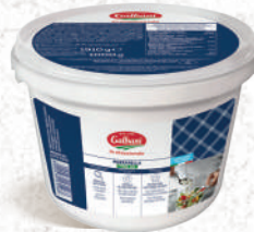
Mozzarella «Mini» 5g et 8g Seau 1kg