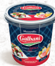
Mozzarella di latte di Bufala «Mini» 10g Pot 500g