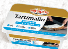
Tartimalin Fromage à la crème Barquette 1kg