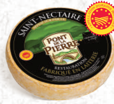
St Nectaire Laitier affiné sur paille Pont de la Pierre Environ 1,8kg