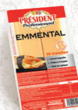
Tranches d'Emmental Baguette 15g Barquette 480g