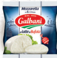
Mozzarella di latte di Bufala Boule 125g