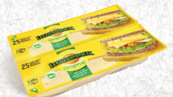
Tranches Leerdammer Original 1kg