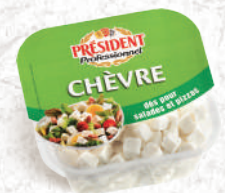
Dés de Cantal, Chèvre et Emmental Barquette 500g