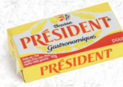
Beurre Doux et Demi-sel Micropains 8,10 ou 15g