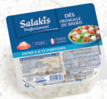
Dés de Fromage de brebis Barquette 500g