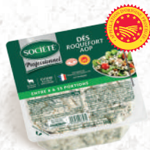
Dés de Roquefort Barquette 500g