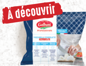
Mozzarella Fiordilatte Boule 125g