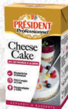
Appareils à desserts : Cheesecake, Mousse au Chocolat noir et Tarte au Citron de Sicile UHT Brique 1L