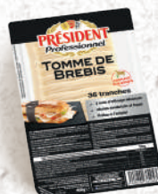
Tranches Tomme de brebis Barquette 400g