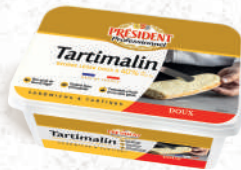
Tartimalin Beurre Tendre léger Doux et Demi-Sel Barquette 1kg